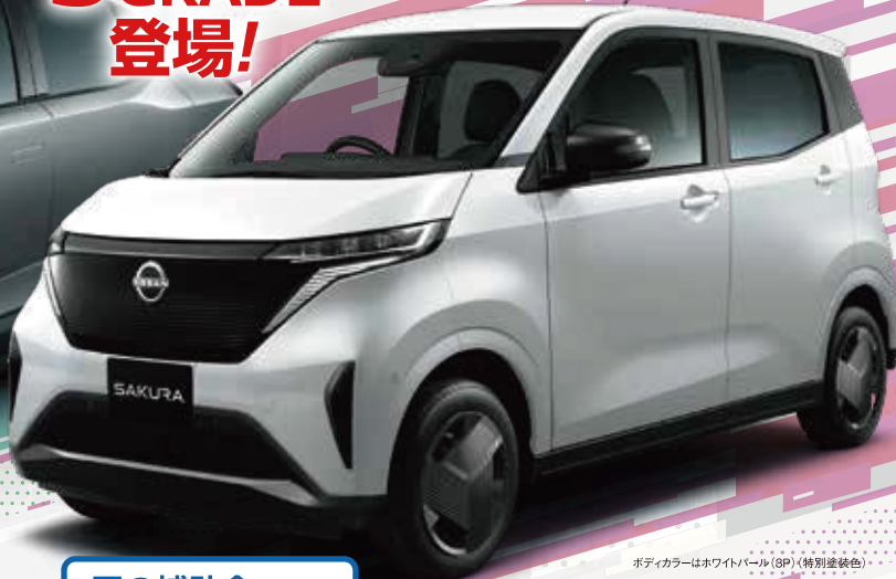
ボディカラーはホワイトパール(SP)(特別塗装色)