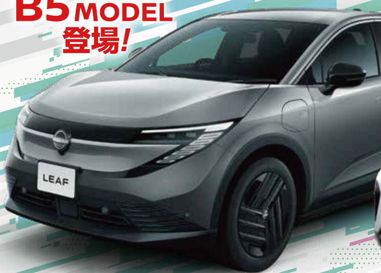
ボディカラーはダークメタルグレー